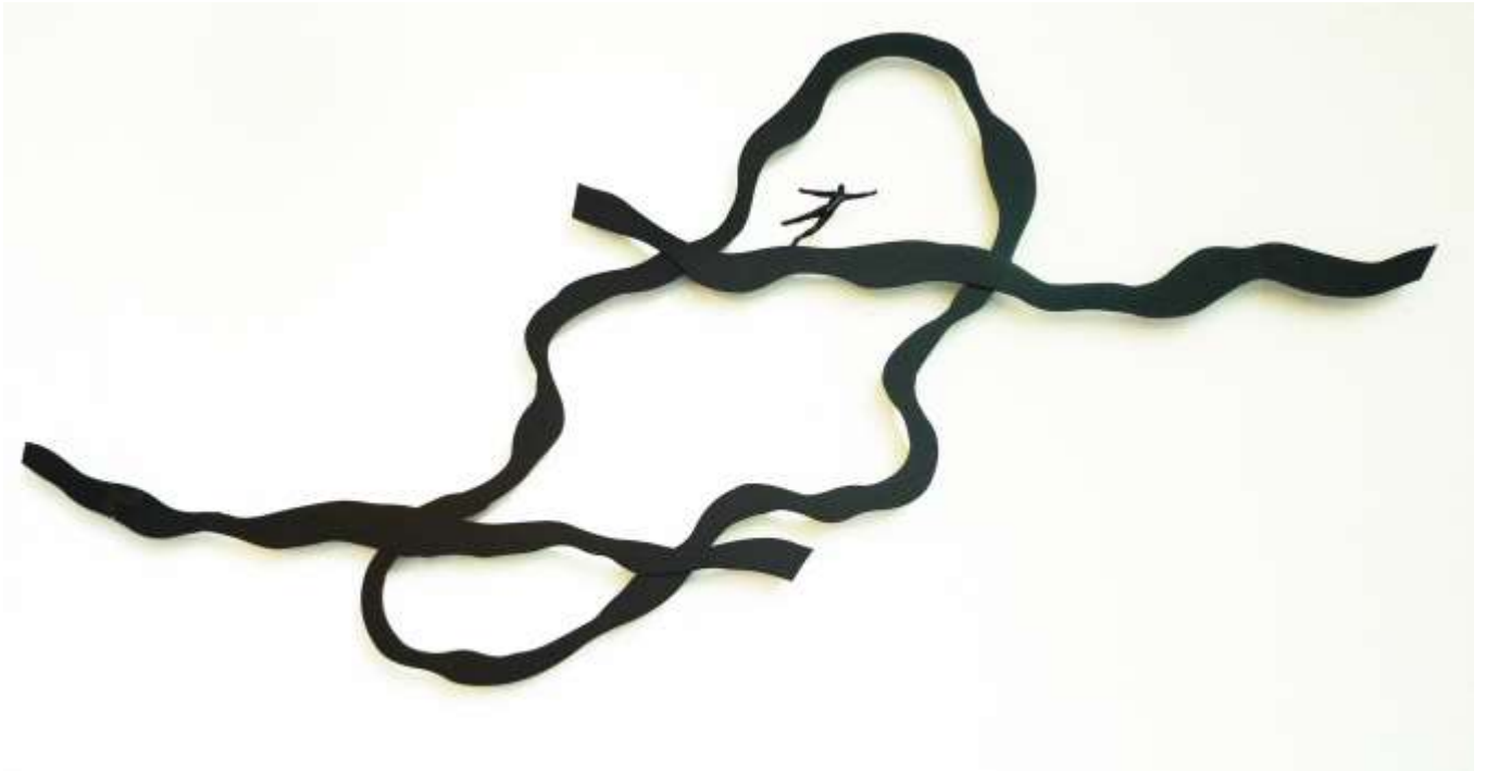
Trajectoires Sculpture aluminium peint 78 x 180 x 3 cm 2015

La Galerie INSULA est heureuse de présenter les sculptures de SADKO du 24 septembre au 31 octobre.