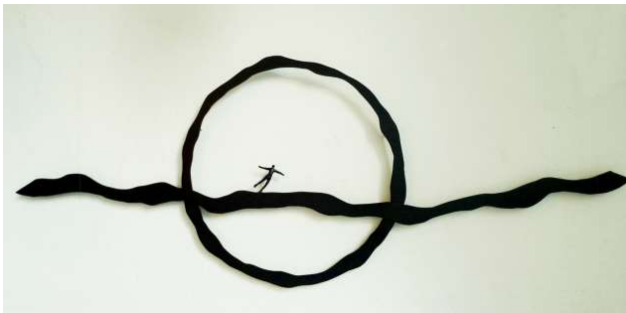
Soleil Noir Sculpture aluminium peint 66 x 180 x 3 cm 2015

Les œuvres de Sadko sont présentes dans de nombreuses collections privées, tant en France, qu'en Angleterre, Allemagne, Belgique, Danemark, Italie, Maroc, Suisse et USA.