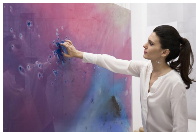
Aura, Performance à l'Auditorium du Musée National d'Art Contemporain Reina Sofia, Madrid, 2014

2009 / La folie d'Ophélie , AEA, Valence*