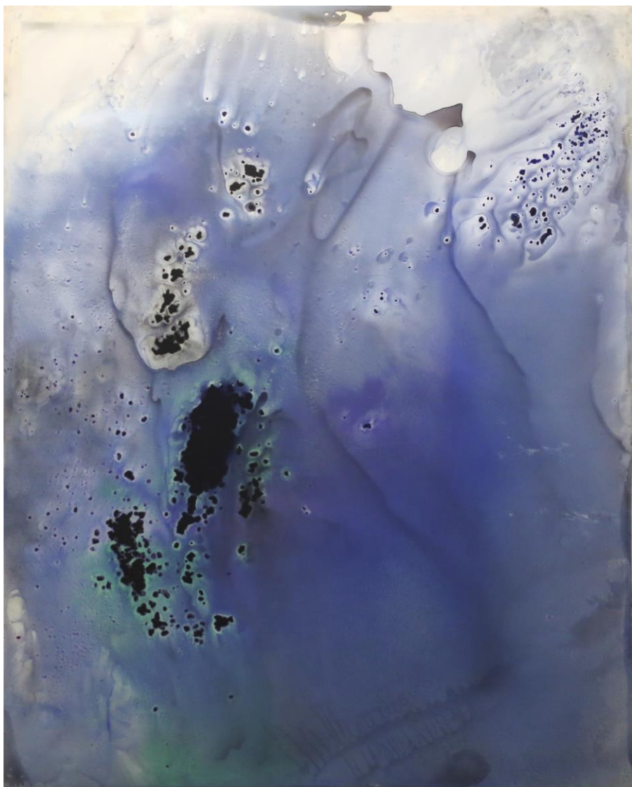
Cristina GAMÓN, Les Piliers de la Création 1 , acrylique sur plexiglas, 230 x 185 cm, 2015

Tomás Paredes, Septembre 2015 Président de l'Association espagnole des Critiques d'art (AICA)