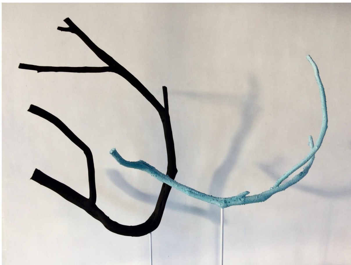
Onde 1 , pigments acryliques et sable sur bois d'azalée, 45 x 82 cm et 60 x 80 cm, 2017

La Galerie Insula donne carte blanche à l'artiste Marie Bathellier pour sa première exposition personnelle à la galerie du 1 er février au 3 mars 2018.