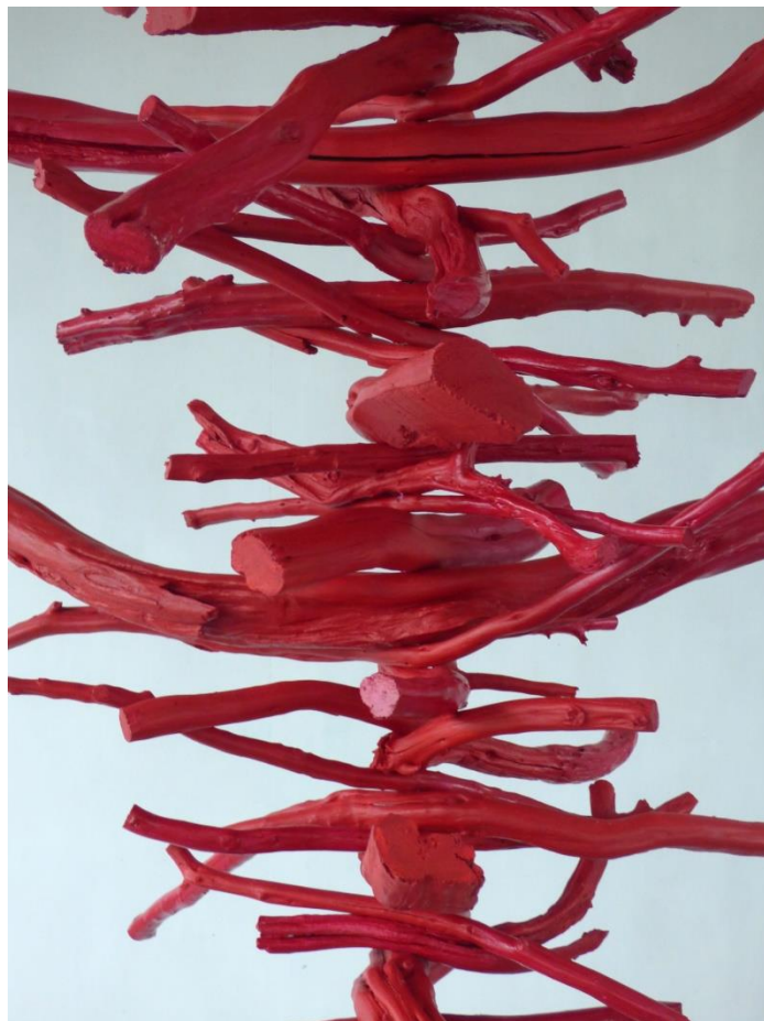
Suspension rouge (détail), pigments acryliques sur bois d'azalée, 100 x 65 cm, 2017

Chaque pièce est créée dans un slow process, instinctivement, en cheminant. De hautes suspensions tombent du plafond, mobiles, hirsutes et colorées.