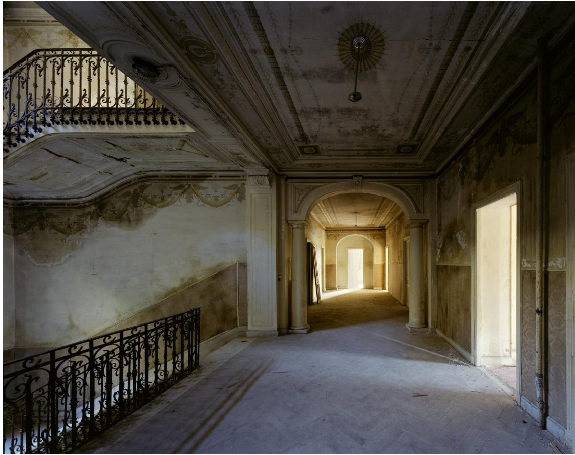
Allégorie 95 x 120 cm Tirage Fine Art Hahnemuhle Ed.8