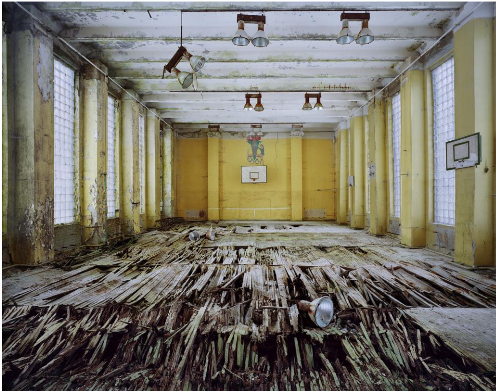
Basket Ball 95 x 120 cm Tirage Fine Art Hahnemuhle Ed.8