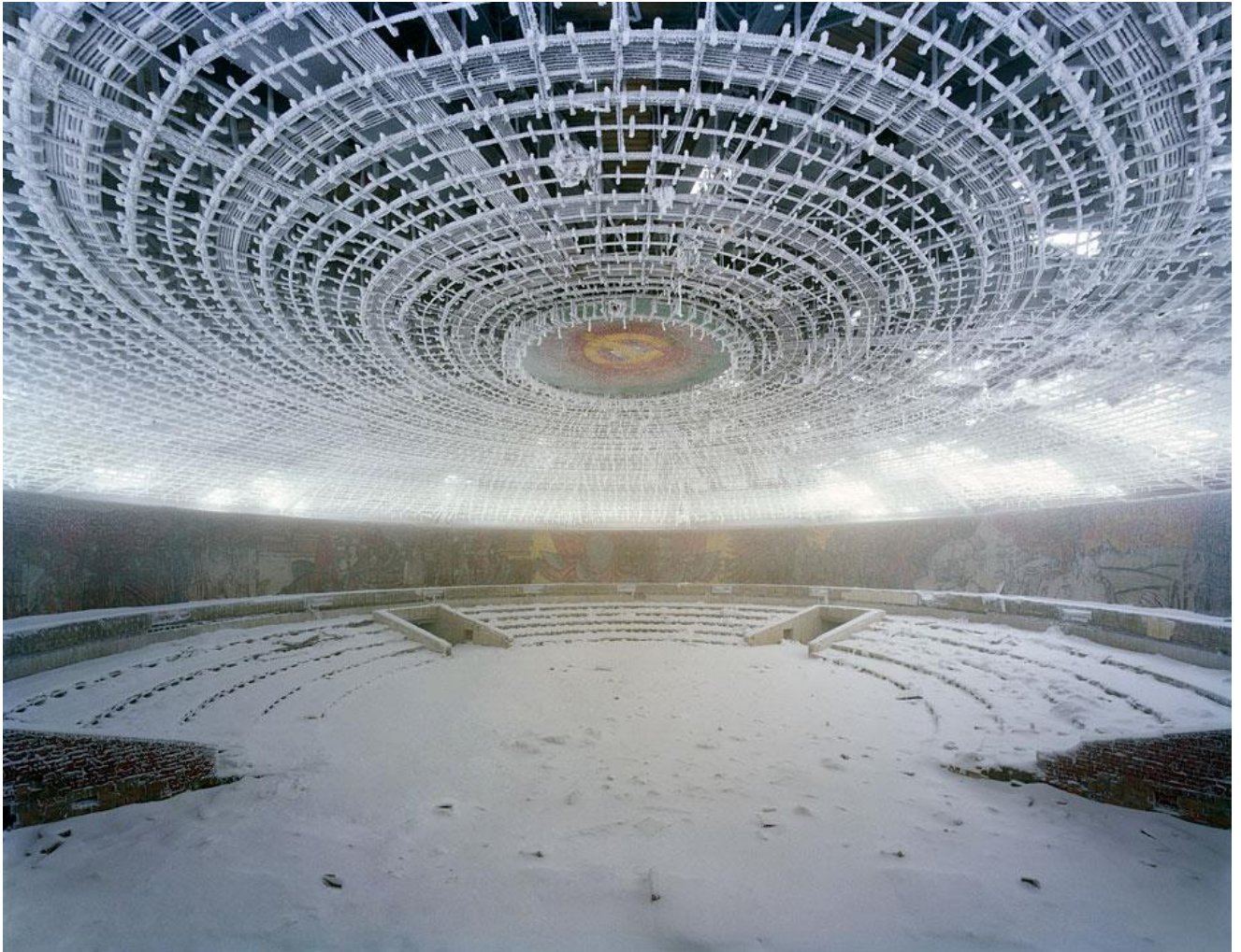
Blizka 120 x 150 cm Tirage Fine Art Hahnemuhle Ed.8

Forte du succès de l'exposition Palais Oubliés en novembre 2012 dans le cadre du Festival Photo Saint-Germain-des-Prés, la Galerie Insula est heureuse de présenter cette année à partir du 10 octobre l'exposition Silencio , une nouvelle sélection d'images du photographe Thomas Jorion.