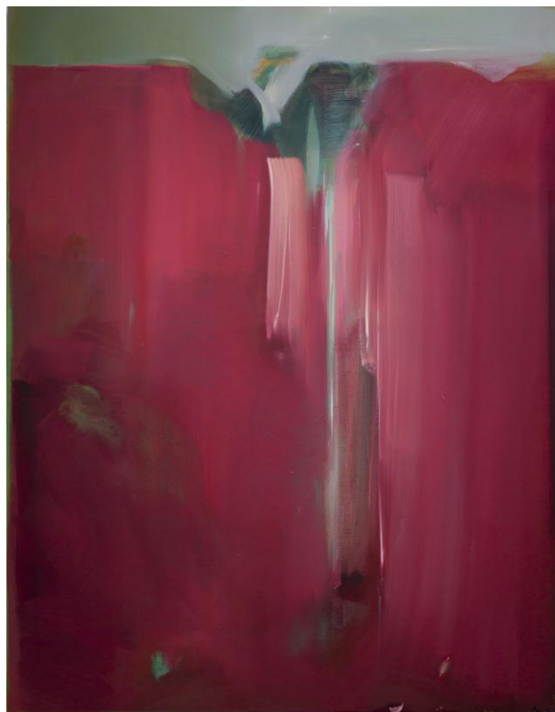
Cascade Pourpre - 2012 Huile sur toile 146 x 114 cm