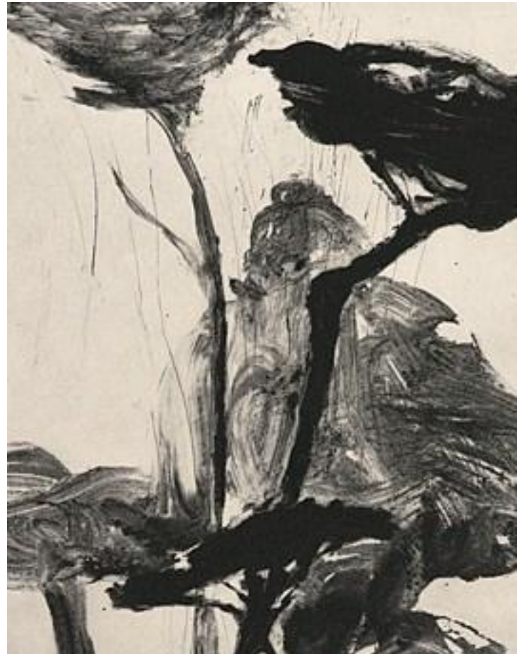
Les pins (détail), gravure, 100 x 70 cm, 2009

Mais au-delà de ces prouesses techniques et la valeur graphique, ce qui reste quand vous quittez l'atelier, c'est l'élan lyrique dans lequel vous a entraîné son œuvre peint et gravé, le délicieux voyage imaginaire dans le monde du sensible, parmi ses paysages ou son bestiaire.