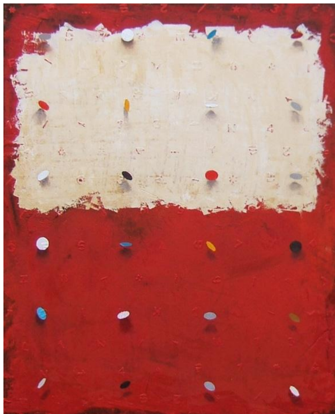
Sans titre 3 , acrylique et huile sur toile, 81 x 100 cm