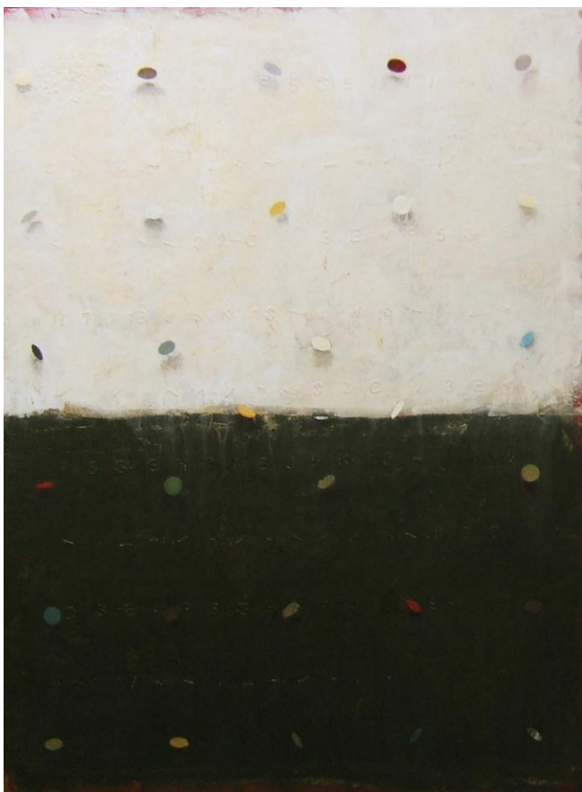
Sans titre 1 , acrylique et huile sur toile, 130 x 97 cm

Les objets peints par l'artiste – sacs, fruits, ou barques à ses débuts, aujourd'hui des formes circulaires – se multiplient comme une semence de la peinture, dans une échappée de battements réguliers.