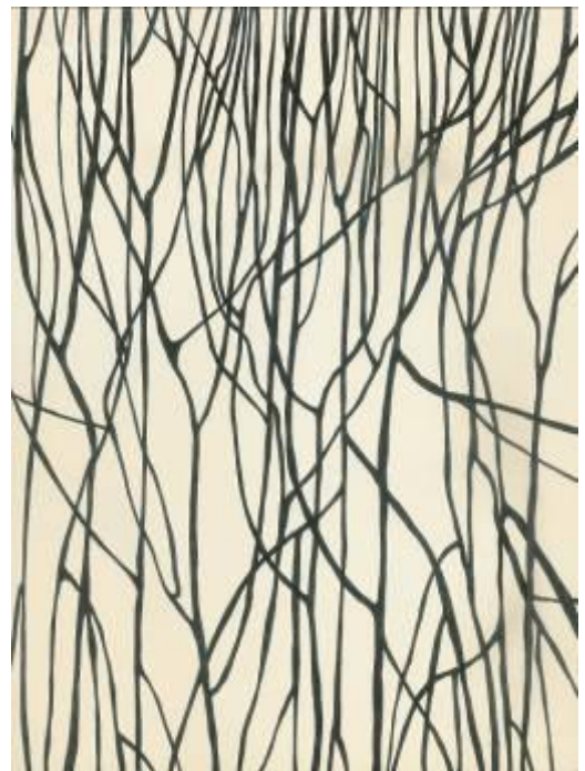
Sans titre, 24 x 18 cm, encre / papier